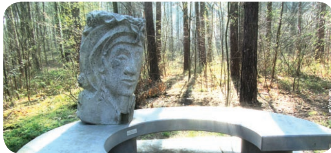
een kunstproject van vzw OVOK-Tessenderlo - april 2012